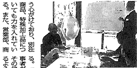
商品の説明会には商品以外からも集まって行う

マイチム数は5000、 取引先は4000社にも 衛生材料をはじめと する医療消耗品を主 に、医療の総合メー カーとして約600 0アイテムを取り扱う 朝日衛生材料。196 1年に設立し、関 西圏を中心に中国、 九州、東海、関東甲信 越から北海道の医療機 関や老健施設など約4 000社と取引する。 国をあげての医療費 削減や診療報酬の改定 により病院経営も競争 力が激化しており、過酷 な状況が長引いている 中、同社のメイン商材 である消耗品はやはり 毎日使用するものであ る事から安全性はもち ろん、コスト削減がよ るん、コスト削減がよ るん、コスト削減がよ るん、コスト削減がよ